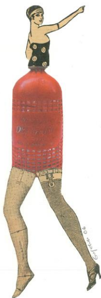
Sí quiero, pero no puedo (2006)

Me defino como observadora ambulante de la vida Defiendo el trabajo artesano de "Cortar y pegar" Sí quiero, pero no puedo / Lo siento no eres tú, soy yo Coleccionista de imágenes, mundos mínimos y singulares Personajes, objetos y paisajes son fragmentados Para posteriormente recomponerse en asociaciones inesperadas Combinaciones armoniosas, poemas visuales Cargados de ironía o crítica Mezcla original de fantasía y transgresión Invito al espectador a participar en una suerte de juego Descubrimiento de una realidad intervenida.